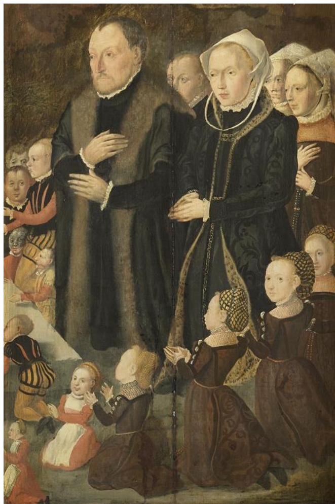
Triptyque de la Famille Booth d'Aertgen van Leyden (détail)