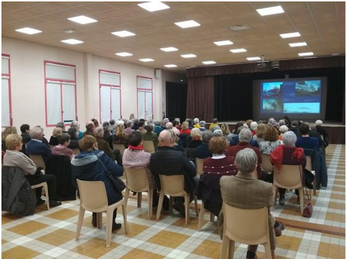
Le public lors d'une conférence organisée par le musée en février 2020