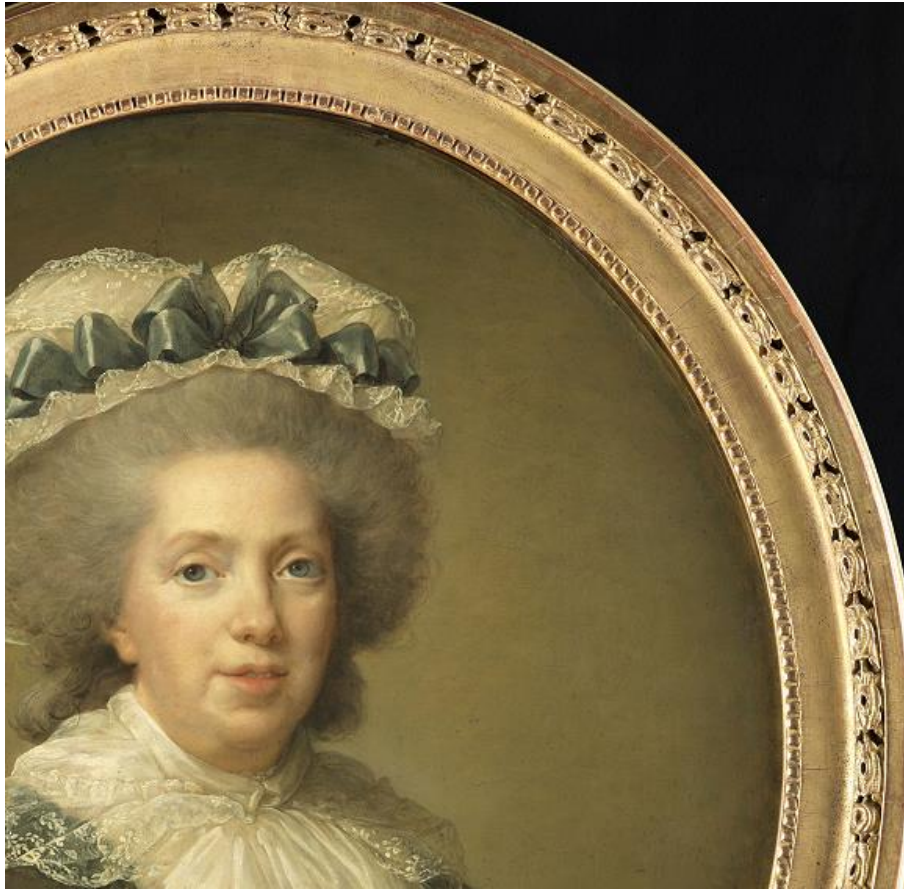
Portrait de Madame Adélaïde, par Elisabeth Vigée-Lebrun (détail), RMN/Benoit Touchard