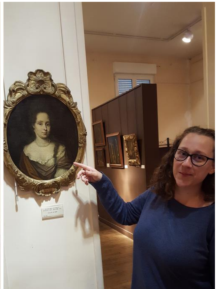
L'équipe du musée proposera des visites consacrées à la thématique du portrait durant l'exposition.